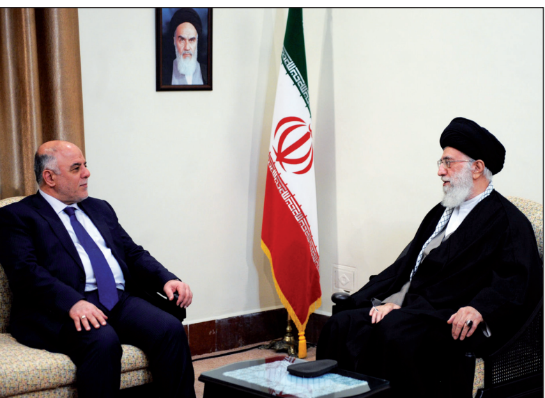
رهبر معظم انقلاب در دیدار با نخست وزیر عراق: