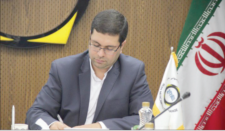
افزایشی بوده است، عنوان کرد: نوسانات زودگذر ناشی از هیجان بازار ارز مانند وضعیت فعلی، در برخی موارد ایجاد می‌شود که ممکن است تحت