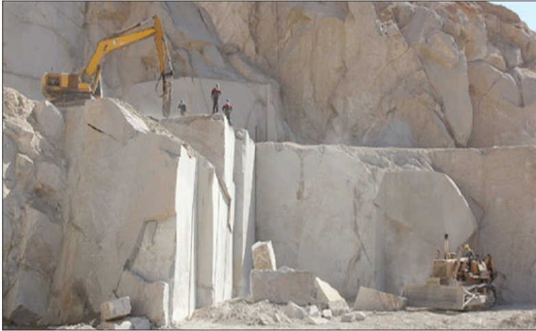
معدن ایران ايراداتی را به نحوه دریافت این یک درصد وارد کرد و با اشلاره به جلسه‌ای که در آن لایحه بودجه ۱۳۹۷ در خصوص ماده ۲۴ بررسی شد و نمایندگان مجلس شورای اسلامی به دریافت